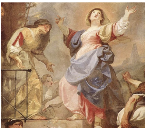
Maria zingt haar magnificat