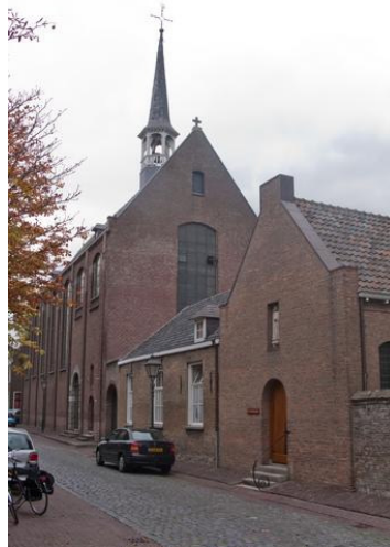
De kapel en de oude klooster-ingang (direct naast de kerkdeur)

Op 22 december hield br. Loek Bosch een lezing over portierschap. Hieronder nemen we enkele delen op.