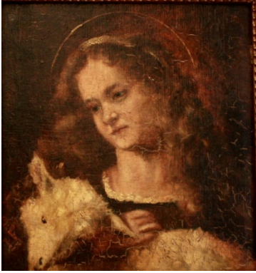
Meisje met het lam of de Hl. Agnes

Br. Everardus was kunstschilder. In deze rubriek staat steeds een werk centraal.