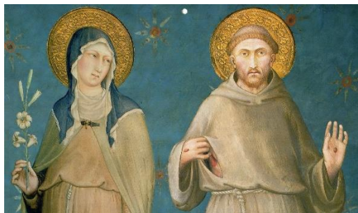
Clara en Franciscus van Assisi

Dierenzegening Op of rond 4 oktober vindt ook de jaarlijkse dierenzegen plaats. Meer informatie en tijden volgen op: www.assiaandemaas.wordpress.com .