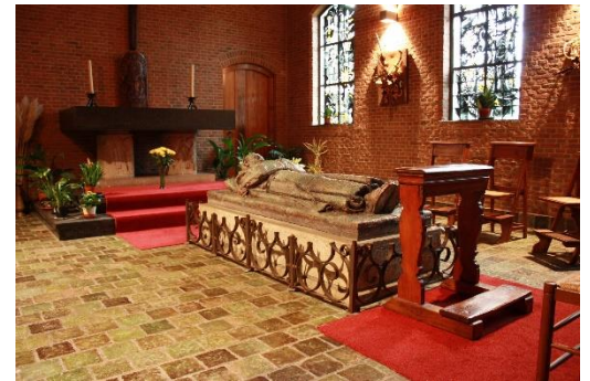
Everardus wacht op uw bezoek

Blijf ook maar een kaarsje opsteken voor hen die in hun onwetende wijsheid in deze tijd leiding moeten geven in ons land. Ik denk altijd: achteraf is kritiek o zo makkelijk te uiten.